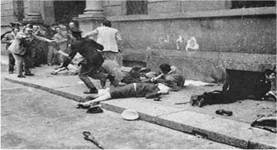
Φωτογραφία απο το αρχηγείο της αστυνομίας στο Μιλάνο μετά την έκρηξη της βόμβας του Bertolli

αντίθετα παραδείγματα σημασίας: Χαρακτηριστικά αναφέρω την εκτέλεση του επιτρόπου Calabresi και την σφαγή στο αρχηγείο της αστυνομίας του Μιλάνο από τον αναρχικό Bertolli, που θα πληρώσει ακριβά τις συνέπειες των πράξεων του, όχι μόνο με τα 20 χρόνια φυλακής, αλλά με την συνεχή συκοφάντηση και σχεδόν απόλυτη απομόνωση του από τη μεριά ενός φοβισμένου και παράφρονος αναρχικού κινήματος.