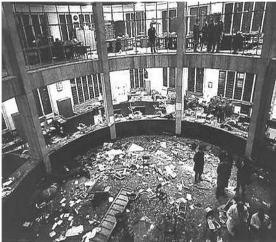
Φωτογραφία μετά την έκρηξη της βόμβας στην Αγροτική Τράπεζα

Μετά την Piazza Fontana υπήρξε διάδοση των νομικίστικων και αθωωτικών αντιερευνών h , στις οποίες η αμαύρωση του αναρχικού ως αιμοβόρου, έρχεται να αντικατασταθεί από ακόμα πιο παράφρονα αμαύρωση, από αυτή του αναρχικού