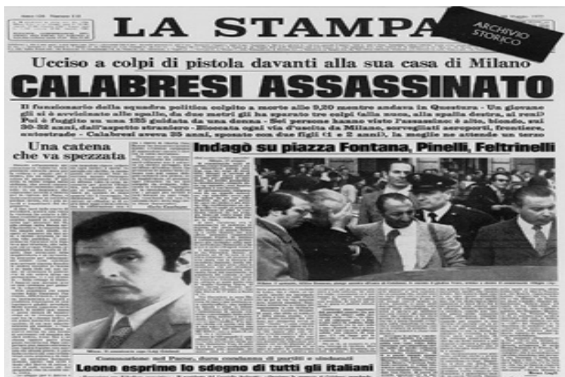
Πρωτοσέλιδο απο την εκτέλεση του μπάτσου Calabresi

αιχμάλωτος, θα αναλάβει την ευθύνη με υπερηφάνεια ως αναρχικός ατομικιστής και θα εξηγήσει την χειρονομία του ως βεντέτα για τη δολοφονία Pinelli : Ο Bertoli συκοφαντείται δημόσια από το κίνημα και οι “ευγενικές” ψυχές της “Rivoluzione” τον ονομάζουν αμέσως φασίστα, πληρωμένο από τις μυστικές υπηρεσίες. Από τις ελάχιστες εξαιρέσεις ήταν η Ponte de la Ghisolfa ο η μιλανέζικη αναρχική λέσχη, που διαχωρίστηκε από την “τρελή” χειρονομία, αλλά τον αναγνωρίζει ως ένα σύντροφο που έσφαλε. Πολλά χρόνια μετά οι περισσότεροι συκοφάντες από ένα δημοκρατικό δικαστήριο θα αλλάξουν άποψη, αλλά αυτό είναι μια άλλη ιστορία πολύ δυσάρεστη που δεν θέλω να διηγηθώ. Μια άσχημη ιστορία εργαλειοποίησης και πολιτικών συμφερόντων.